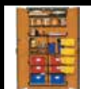
Gabinetes para escuela primaria