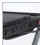
Tomacorriente múltiple opcional integrado