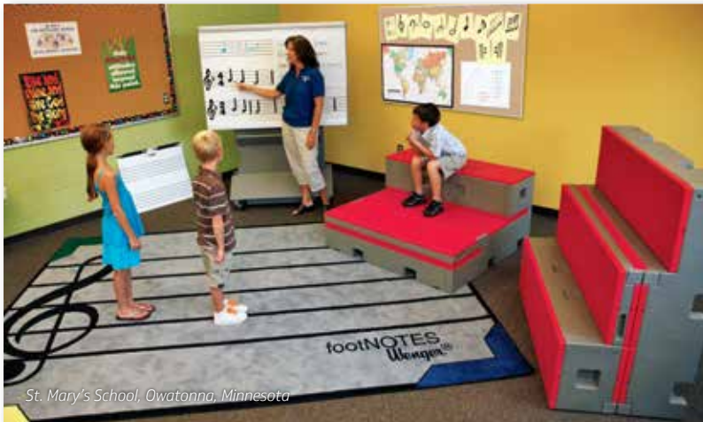
St. Mary's School, Owatonna, Minnesota

Plataformas versátiles de varias posiciones para uso en clases de escuela primaria o en el teatro.