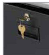
Cajón de almacenamiento opcional con cerradura