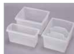
Hay disponibles cestos semiopacos transparentes.