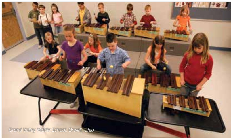
Grand Valley Middle School, Orwell, Ohio

Almacenamiento y transporte a medida de los instrumentos valiosos para las clases en la escuela primaria.