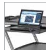
Estante deslizable opcional