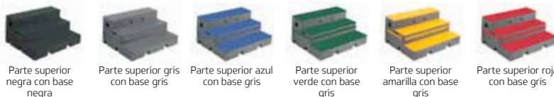
Parte superior negra con base negra