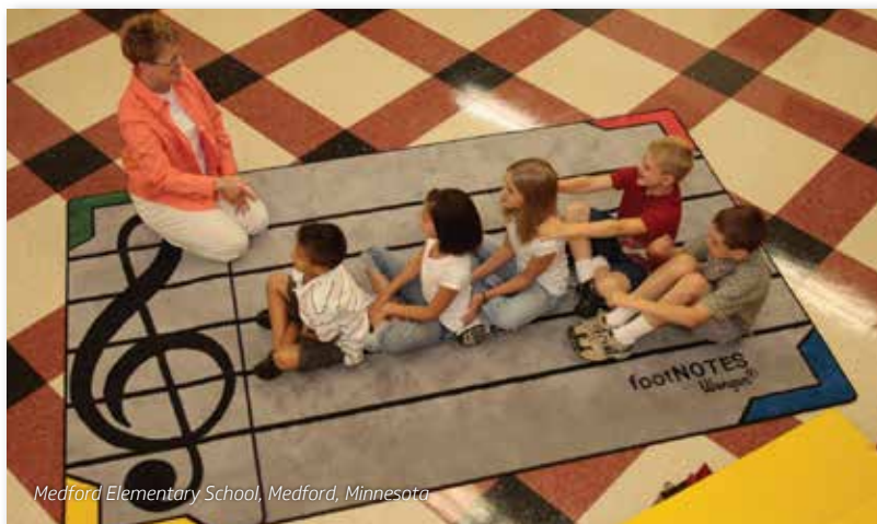
Medford Elementary School, Medford, Minnesota

Alfombra para clase de escuela primaria para la enseñanza de la música.