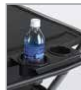
Manija robusta y dos apoyavasos