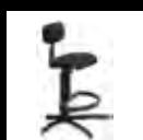
Silla para directores