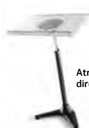
Atril para directores