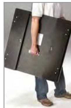
Doble el armazón y utilice la manija para transportarlo.