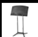
Atril para directores Preface®