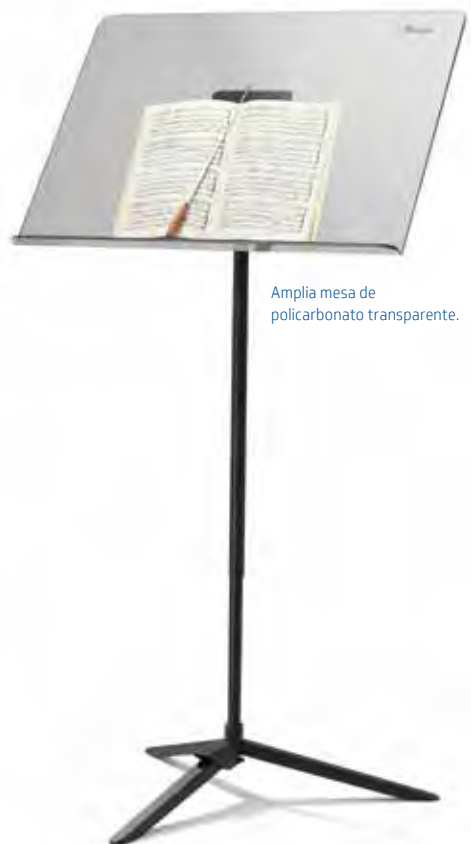
Amplia mesa de policarbonato transparente.

Las herramientas básicas que necesita para dirigir una sala o un escenario repletos de músicos.