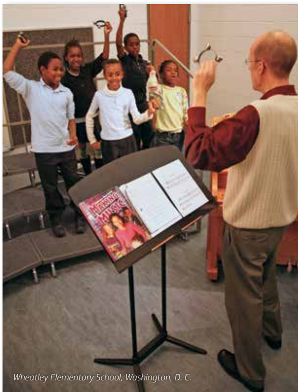
Wheatley Elementary School, Washington, D. C.

Atril para director de amplio tamaño con capacidad adicional de almacenamiento.