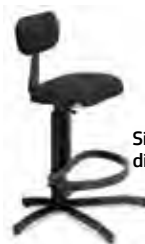
Silla para directores