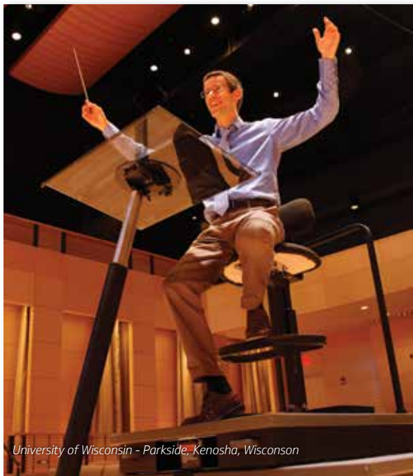
University of Wisconsin - Parkside, Kenosha, Wisconsin

Podio, silla y atril duraderos, diseñados especialmente para directores.