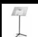
Atril para directores