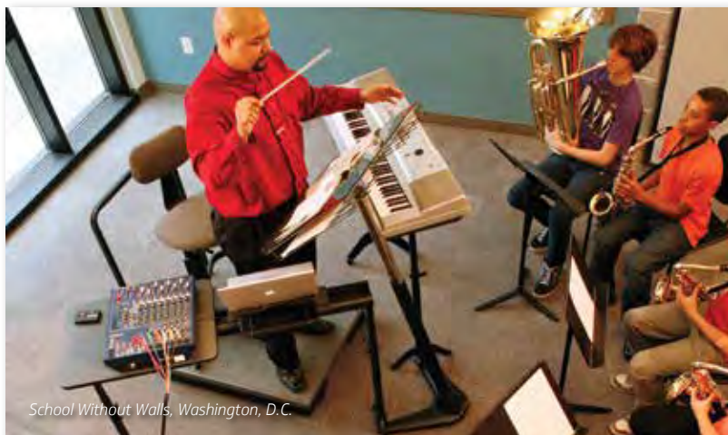
School Without Walls, Washington, D.C.

El sistema Flex le permite personalizar el espacio de enseñanza musical con los componentes y accesorios que usted necesita. Simplemente, incorpore nuestros atriles, puentes, sillas, podios y accesorios.