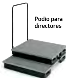
Podio para directores

Comuníquese con nosotros para solicitar más folletos o material, o bien visite nuestro sitio web.