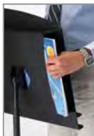
La caja de almacenamiento se extiende a lo ancho del atril y se puede acceder a ella desde ambos lados.