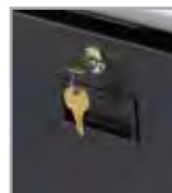
Cajón de almacenamiento opcional con cerradura