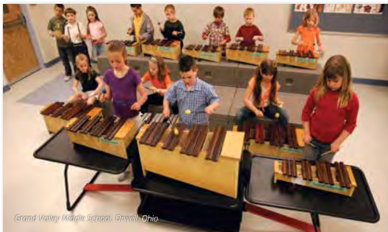
Grand Valley Middle School, Orwell, Ohio

Almacenamiento y transporte a medida de los instrumentos valiosos para las clases en la escuela primaria.