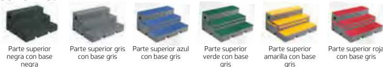
Parte superior negra con base negra