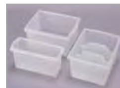
Hay disponibles cestos semiopacos transparentes.