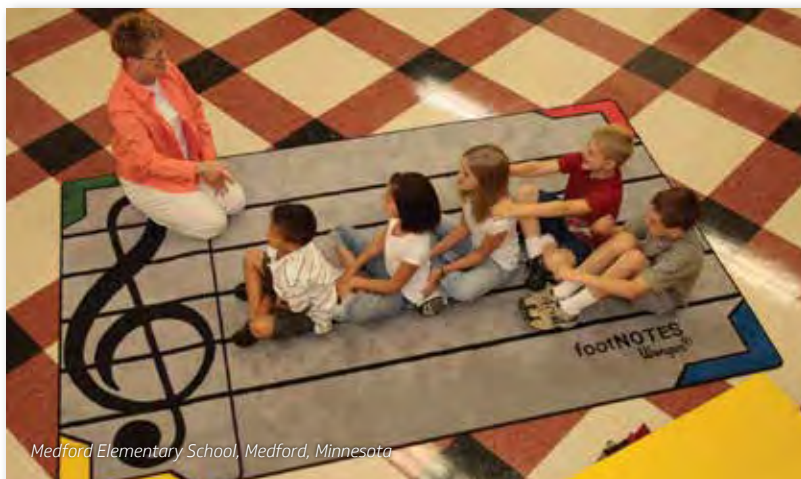
Medford Elementary School, Medford, Minnesota

Alfombra para clase de escuela primaria para la enseñanza de la música.