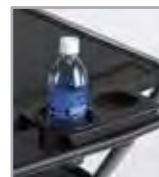
Manija robusta y dos apoyavasos