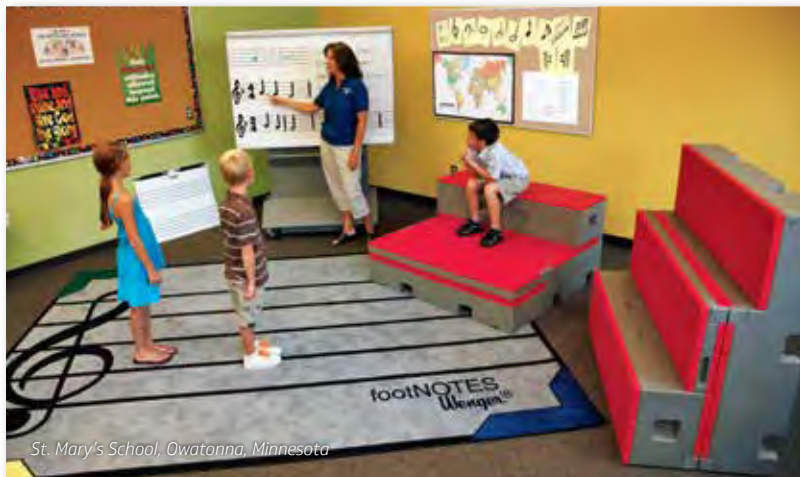
St. Mary's School, Owatonna, Minnesota

Plataformas versátiles de varias posiciones para uso en clases de escuela primaria o en el teatro.