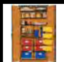
Gabinetes para escuela primaria