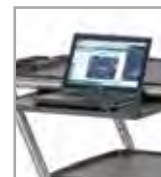
Estante deslizable opcional