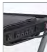
Tomacorriente múltiple opcional integrado